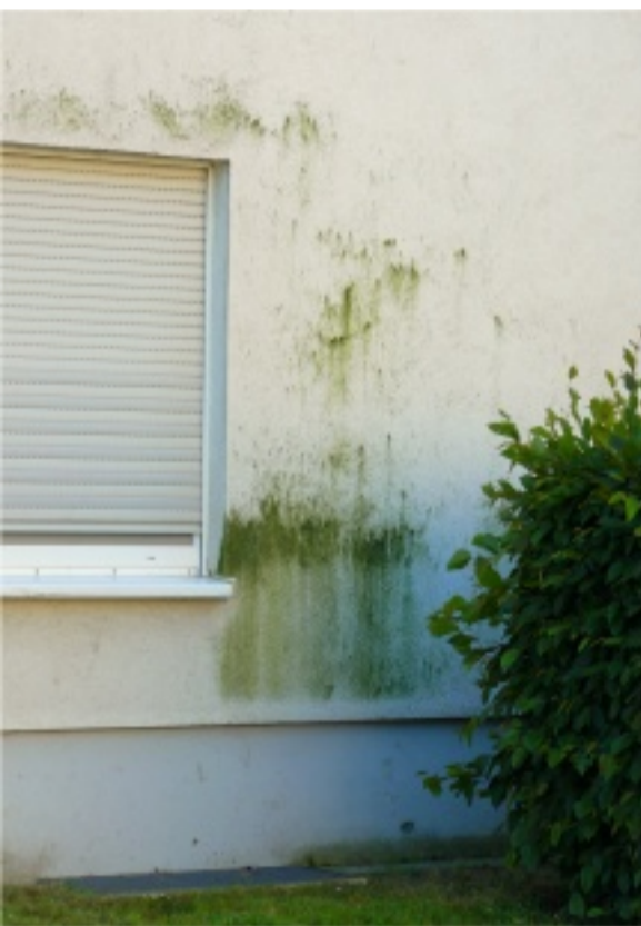
Eine veralgte Fassade

Hierzu wurden spezielle Farben entwickelt.