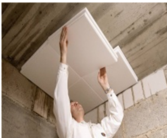
Die Dämmung der Kellerdecke sorgt für angenehme Fußwärme

Kellerdeckendämmung ist üblicherweise relativ problemlos anzubringen, wenn nicht Rohr- oder Kabelleitungen direkt an der Decke verlegt sind. Kellerdeckendämmungen müssen nicht zwangsläufig gestalterisch überarbeitet werden.